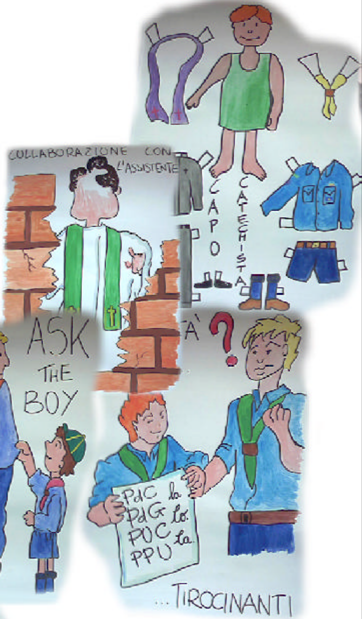
Disegni di Gaia Lugli